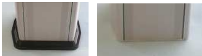
Stopki słupków Codi BT: z lewej Codi BT 80/80, z prawej Codi BT 120/90.

(z ABS, lub, na życzenie, z blachy stalowej).