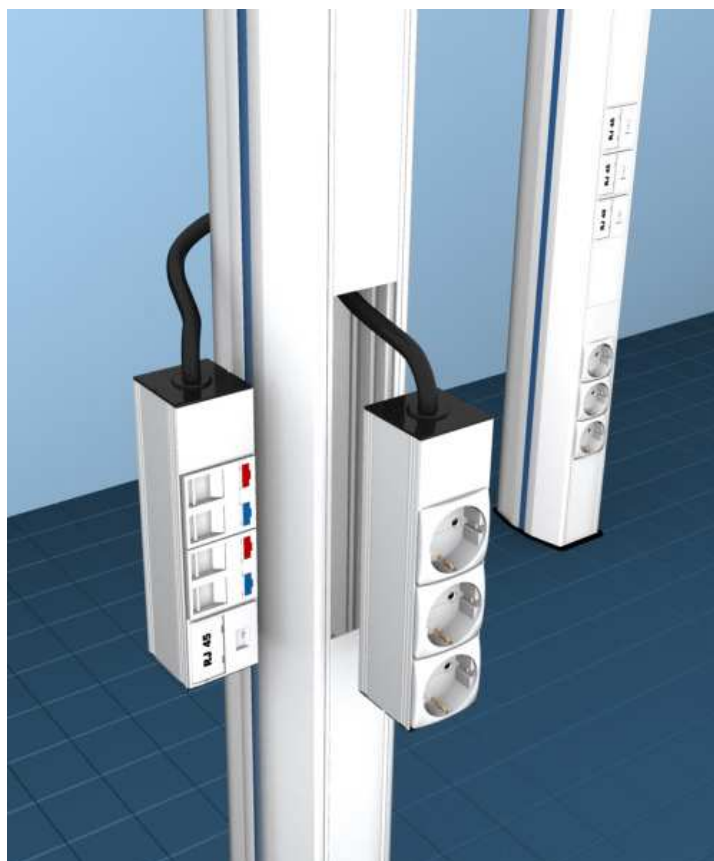
Widok słupków Codi BT.