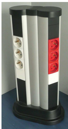
Widok kompletnego słupka Codi Sigma.