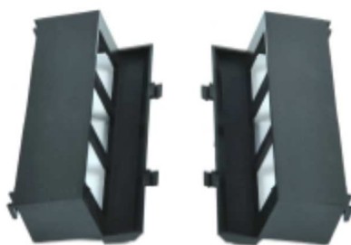
2 puszki montażowe GBM3 .