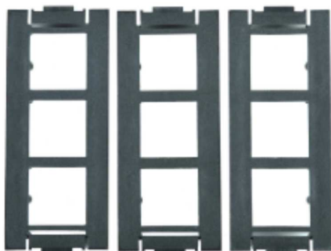
3 puszki montażowe GBPM6D