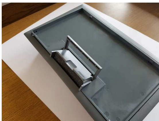
Nowe ciągno z tworzywa.