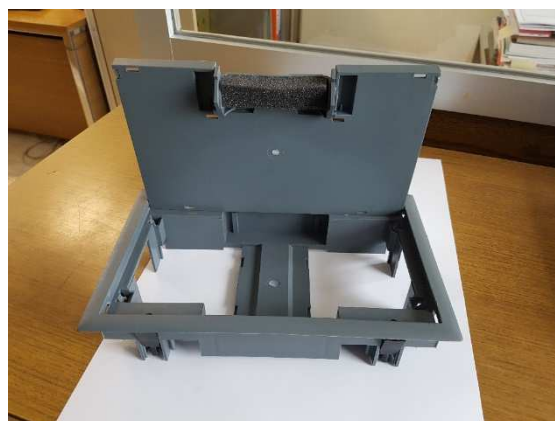
Widok zamkniętej i otwartej pokrywy PPZ 04.