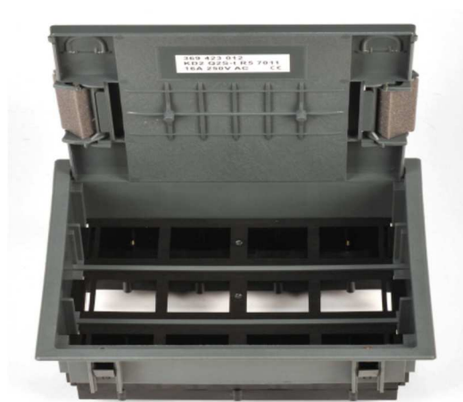
Widok otwartej pokrywy Q2S - 569t

Uwaga: montaż pokrywy w wylewce w puszce podłogowej UDH Q2 .