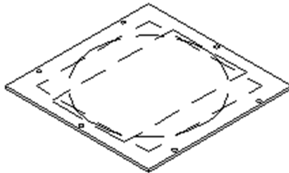
Szkic ramy montażowej UDM2 (różne otwory pod PPZ).

W celu osadzenia florboksów w puszcze uniwersalnej UDH2 , niezbędne jest zamontowanie w niej ramy montażowej (dopasowującej) UDM2 , wykonanej z grubej (4 mm) blachy stalowej.