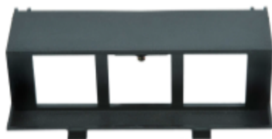
Pojedyncza puszka montażowa GBM3 .

Układ gniazd w pokrywie: skośny (wtyczki wsuwane w gniazda - z boku ).