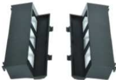
2 puszki montażowe GBM3 .