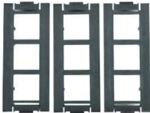
3 puszki montażowe GBPM6D