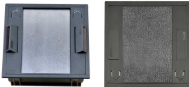
Widok zamkniętej pokrywy Q2S - 569t