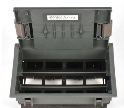
Widok otwartej pokrywy Q2S - 569t

Uwaga: montaż pokrywy w wylewce w puszce podłogowej UDH Q2 .