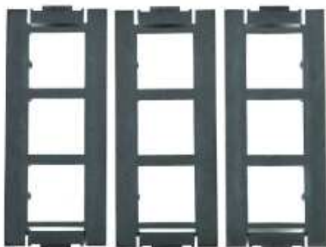
3 puszki montażowe GBPM6D