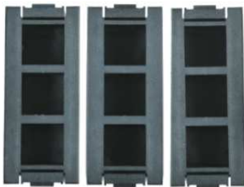
3 puszki montażowe GBPM6S

GBPM6D - puszki od spodu otwarte nr katalog. 659 601 020 .