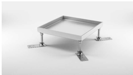
Kaseta ECO bez wypustu, ślepa.