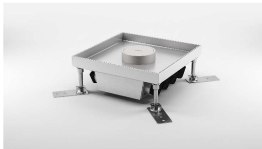
Kaseta ECO z zespołem pod tubus.