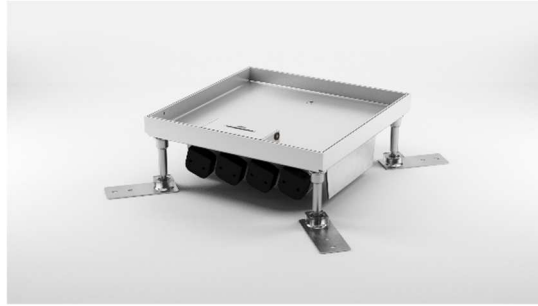
Kaseta ECO z wypustem uchylnym.