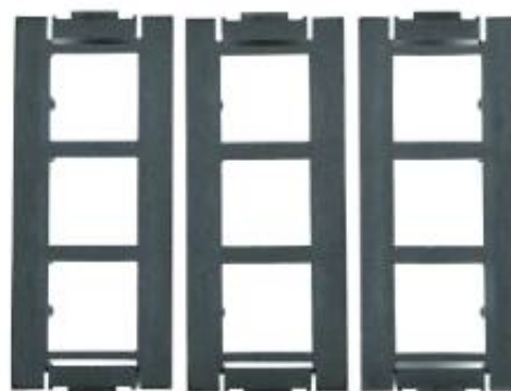
3 puszki montażowe PM09 M6D