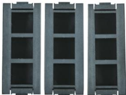
3 puszki montażowe PM09 M6S

PM09 M6D - puszki od spodu otwarte, nr katalog. 459 601 020 .